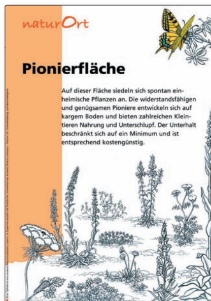
L 2 Pionierfläche