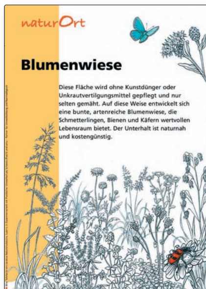
L 1 Blumenwiese

carabus Naturschutzbüro, Brambergstrasse 3b, 6004 Luzern fon 041 410 20 63, fax 041 410 20 69 www.carabus.ch