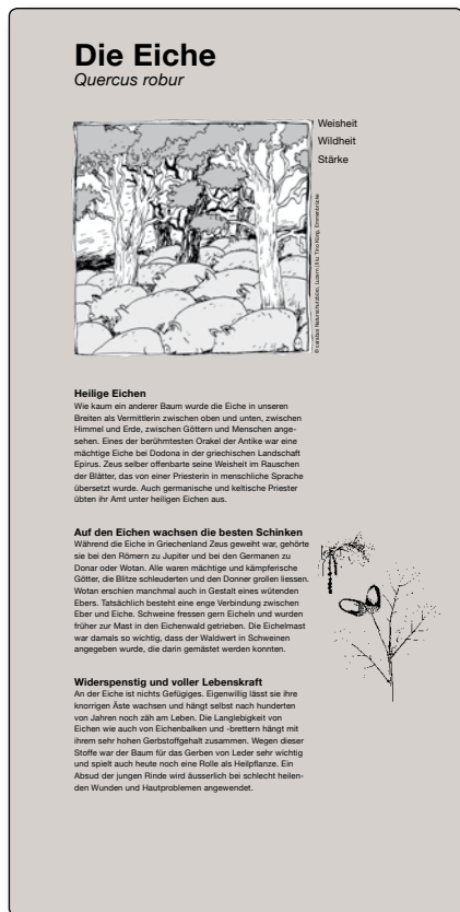
M 3 Eiche

Auf den hier angebotenen Baumtafeln werden die Eigenschaften von ausgewählten Baumarten beschrieben und durch eine aussagekräftige Illustration zu Ausdruck gebracht. Die Tafeln eignen sich für die Anlage eines Baumerlebnispfades und laden dazu ein, sich Zeit zu nehmen, um über den Baum, seine Symbolik und sich selbst nachzudenken.