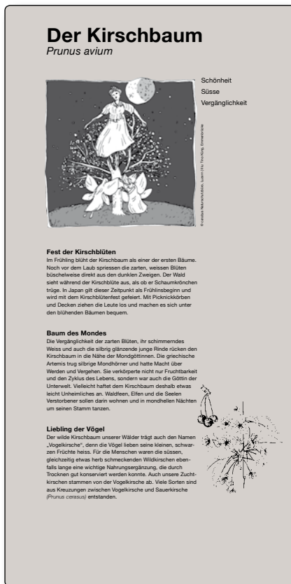
M 6 Kirschbaum